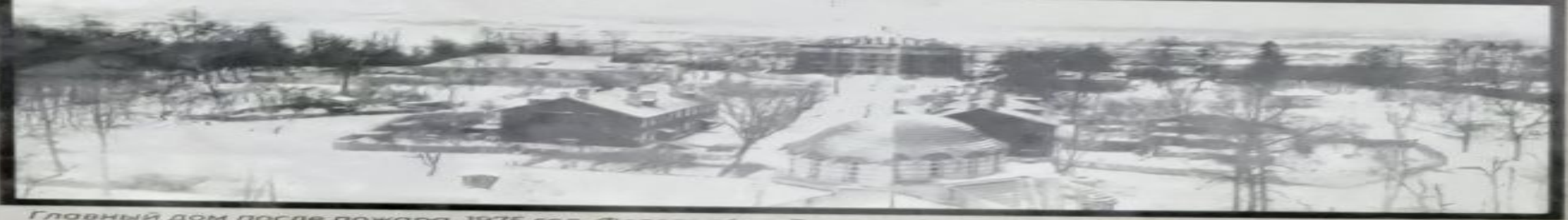
Главный дом после пожара. 1975 год.